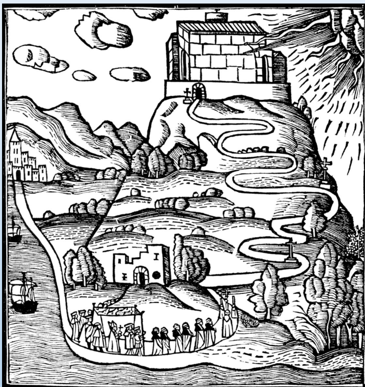
El Puig de Randa a l' Ars inventiva veritatis . Diego de Gumiel (1515).

Durante el siglo XV solo hay documentación relacionada con las construcciones de la cima del Puig de Randa. En 1509 aparece documentada por primera vez la existencia de una capilla. Habían pasado más de doscientos años desde la iluminación de Ramon Llull.