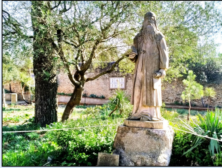
Estatua de Ramon Llull en el monasterio de Cura.

En agosto de 1913, el obispo Pere Joan Campins cedió el santuario de Cura a los hermanos franciscanos del tercer orden regular. El programa de restauración del lugar luliano se inició con la recuperación del espacio de la Cueva y bien temprano este lugar se convirtió en punto de peregrinación del catolicismo insular.