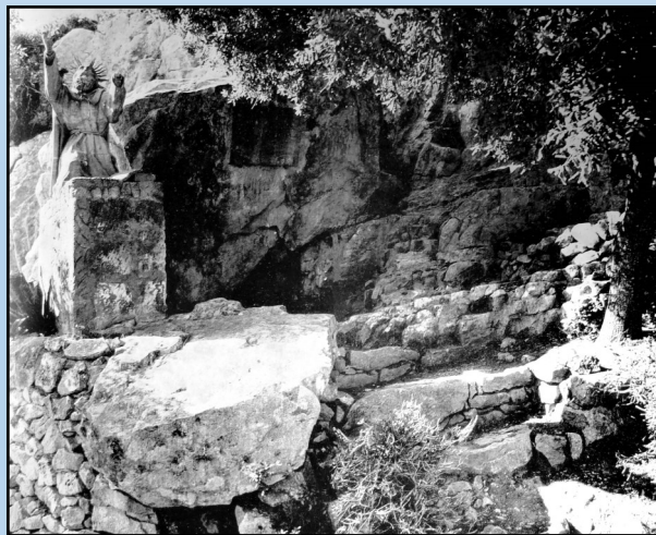
Fotografía del libro Rutes amagades de Mallorca, 24. Puig de Randa des de Algaida, per Castellitx i Albenya (1968).

La cueva de Ramon Llull presenta una entrada angosta, afectada por desprendimientos de roca. La cavidad no es muy profunda y es de altura escasa, de modo que sólo cabe una persona acostada. Según la descripción del archiduque Luis Salvador, la cavidad tenía una abertura de 2,5 metros y una profundidad de 2 metros.