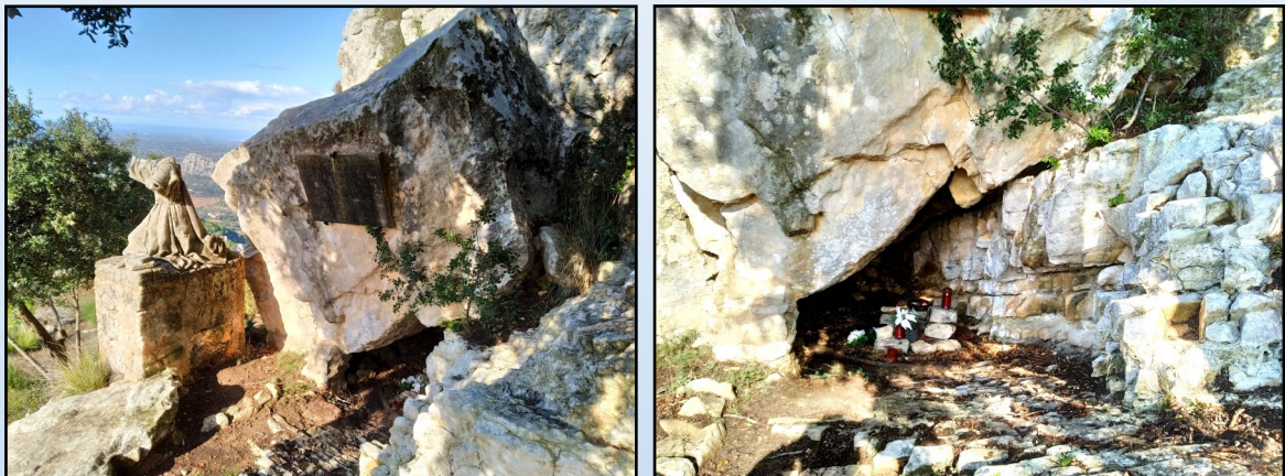
Estado actual de la cueva.

Cabe señalar que la panorámica sobre el mediodía de Mallorca, desde este rincón, es espectacular. La presencia de bancos invitan al visitante a sentarse y dejarse maravillar por la contemplación de las vistas.