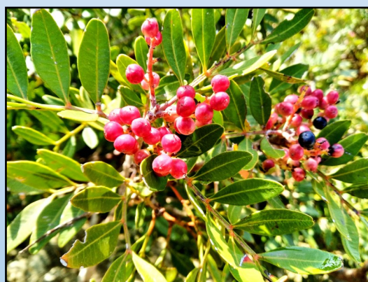
El célebre lentisco que ha forjado la leyenda de la mata escrita.

En lo que respecta a la vegetación, cabe indicar que es la típica de monte bajo. Abundan los pinos, algunos de ellos dentro de artesas, así como los acebuches, las encinas, los arbustos y el carrizo. Se debe destacar el célebre lentisco que ha forjado la leyenda de la mata escrita, que según la tradición tuvo lugar en esta cueva. Las hojas de esta mata tienen una serie de signos extraños, talmente letras de alfabetos arcaicos, que se imprimieron después de que Dios revelara a Ramon Llull el Art General . Así lo explica el poeta Miquel Costa i Llobera: