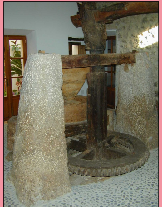
Molins de sang de Solleric (Alaró), Son Marc i Els Rafals (Pollença), i Son Gual (Inca)