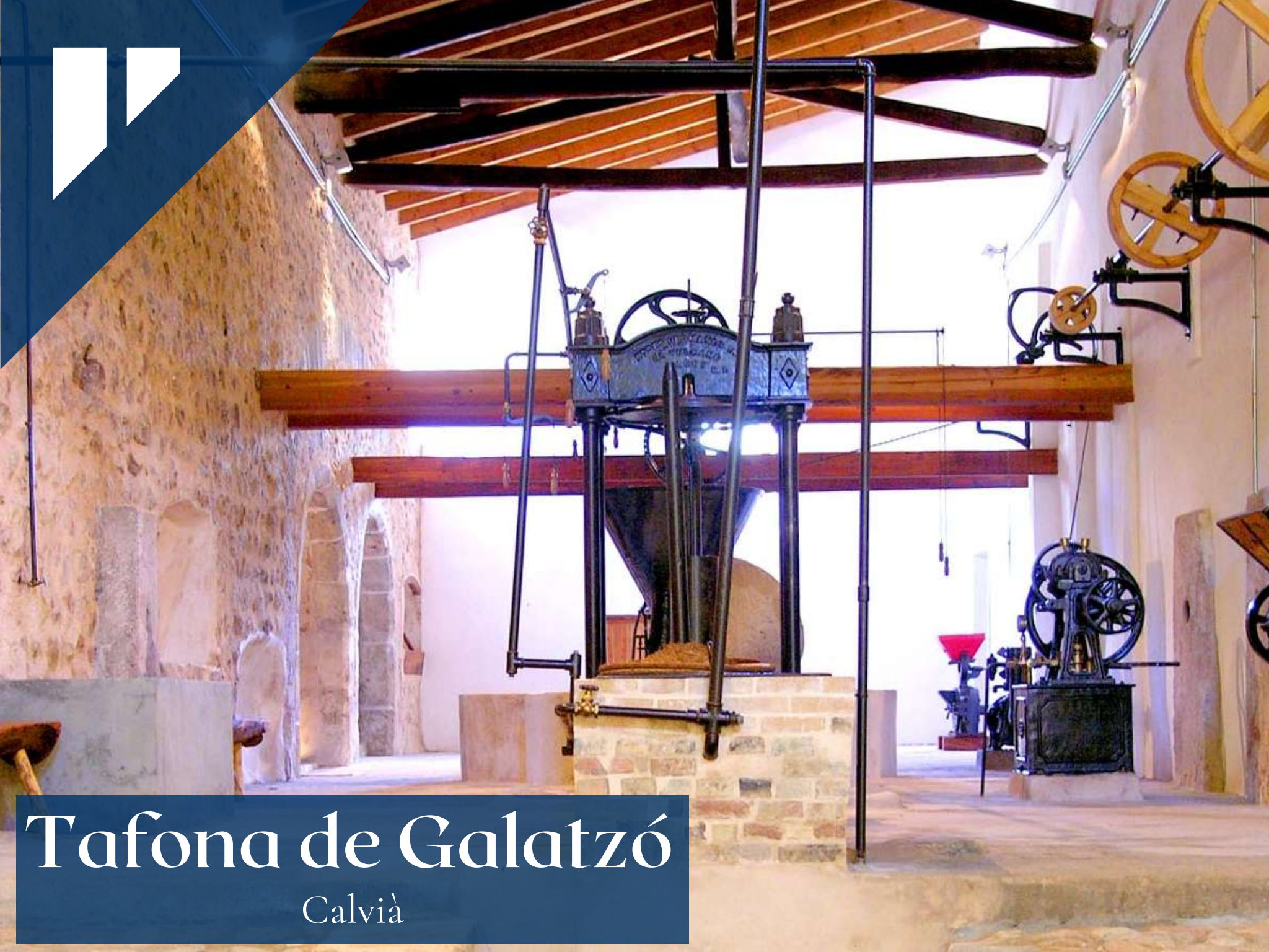
Tafona de Galatzó Calvià