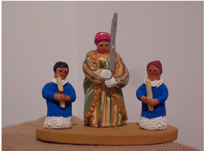
Sibil·la de Lluc amb blavets turiferaris, betlem particular

Elabora una figura de Sibil·la per posar al betlem de l'escola o de ca teva. Utilitza una tècnica mixta a partir d'un material moldelable (plastilina, fang, argila, etc.).