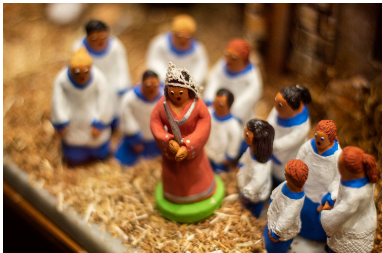
Sibil·la amb blavets de Lluc, Fornet de la soca, Palma 2020

El betlem és la representació figurativa del naixement de Jesucrist i constitueix una de les tradicions més arrelades a les llars il·lenques. Es considera que el primer betlem o pessebre el va crear Sant Francesc d'Assís l'any 1223. A Mallorca, hi ha referències de betlems al segle XVI, concretament del betlem de l'església de l'Hospital General. Probablement, durant els segles posteriors el costum es va expandir entre els convents de clausura. El betlem casolà es construeix a partir d'elements vegetals, amb una cova o un estable com a elements estructurals. Les figures del naixement (la Verge, sant Josep i el Bon Jesús, el bou i el mul), l'àngel i els tres reis configuren els personatges essencials del relat del misteri de Nadal. El conjunt es completa amb figures que representen escenes i costums rurals.