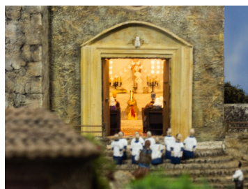
Escena del betlem de la Misericòrdia, Palma 2020

Opcionalment, pots visitar el betlem de la parròquia del teu poble o algun dels betlems tradicionals de Palma, així com les paradetes de pastorets de fang de la plaça Major (consulta el programa de l'Associació betlemistes de Mallorca).